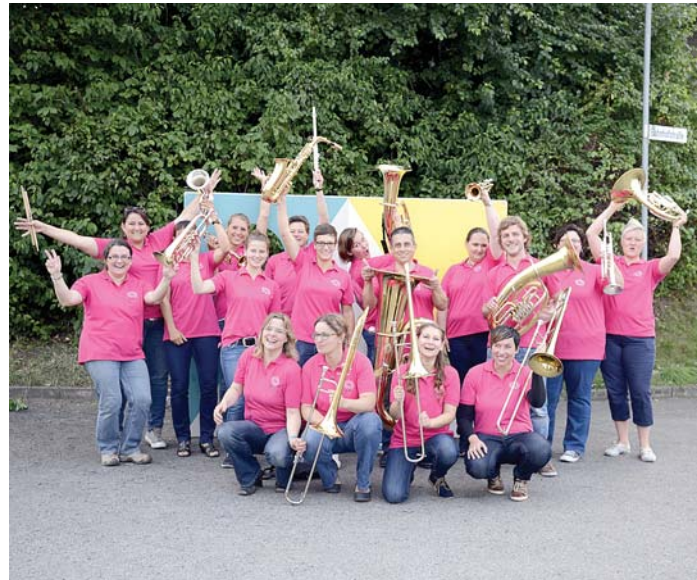
Zum 21. Seehasfest lädt der Musikverein Mühlhausen am kommenden Wochenende ins Festzelt am Bahnhofsgelände in Mühlhausen ein. Für musikalische Unterhaltung am Samstag, 11. Juli, beim Jubiläumsabend zum 85-jährigen Bestehen des Musikvereins Mühlhausen, werden unter anderem die »Weibsbilder« sorgen, junge und junggebliebene Frauen von 18 bis 55 Jahre aus dem Hegau von Stockach bis Kirchen-Hausen unter der Leitung von Katja Deuer.