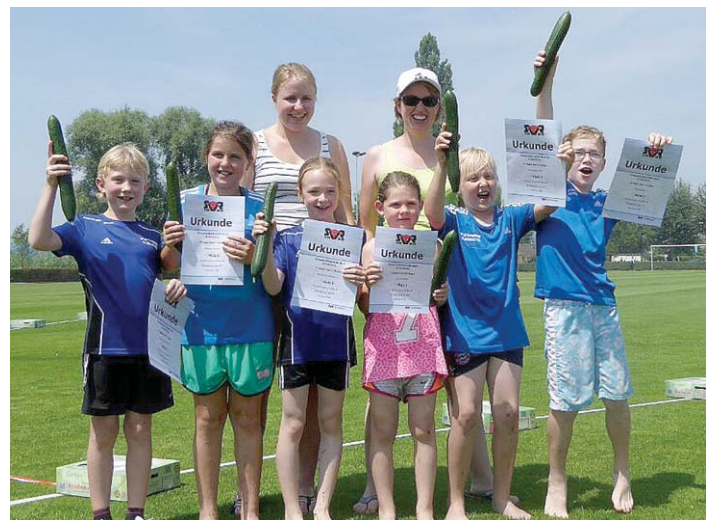
»Die Leoparden« des TV Engen erkämpften sich beim dritten Mannschaftswettkampf im Rahmen der »Kinderleichtathletik« den zweiten Platz und eine Salatgurke auf der Reichenau.

Wie sich am Ende herausstellte, entschied allein die Wurf-Disziplin über die Endplatzierungen, da nach dem Laufen und Springen alle Mannschaften punktgleich waren. Gespannt warteten die Kinder auf die Siegerehrung. Am Ende reichte es knapp nicht zum Sieg, wobei sich die Kinder auch über einen guten zweiten Platz freuten. Mit jedem Wettkampf konnten sie sich bisher um eine Platzierung vom vierten über den dritten nun zum zweiten Rang verbessern. Als Geschenk bekamen die Kinder vom Reichenauer Veranstalter eine Salatgurke.