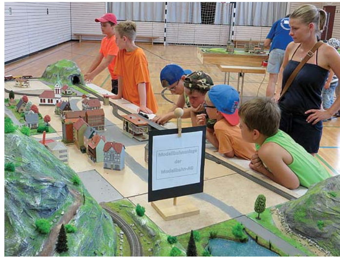
Beim Schulfest an der Grund- und Werkrealschule Mühlhausen-Ehingen war auch die in der Modellbahn-AG entstandene Eisenbahnanlage zu besichtigen. Außerdem hatten die Modellbahnfreunde Mühlhausen-Ehingen eine Spielanlage aufgebaut.