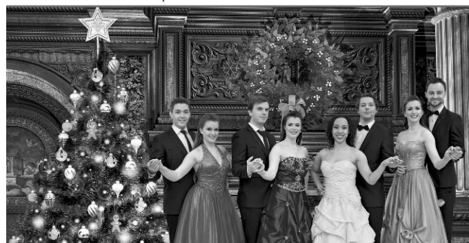
„A Musical Christmas“ kommt am 26.12. nach Engen

Tickets: www.resetproduction.de / 0365 - 5481830, in der Touristinformation Marktpassage/Stadthalle in Singen sowie an allen bekannten VVK-Stellen.