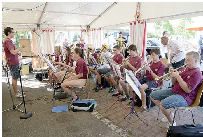
Die Jugendkapelle JUKAMS (Mühlhausen-Schlatt) hat ihren traditionellen Auftritt beim Seehasfest am Sonntag, 12. Juli, von 15.30 bis 17 Uhr.