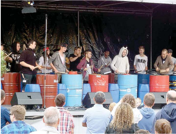
Das zweite Open-Air-Konzert »Sound am Bach 2015« auf dem Gelände der Heimsonderschule »Haus am Mühlebach« war ein zwar nicht ganz regenloser, aber wunderschöner und letztlich sogar recht sonniger Tag voller Musik, Kultur, Kommunikation und ganz viel Spaß und Freude.